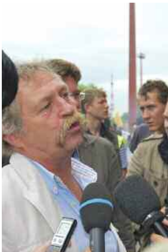
Bové en una manifestación en Estrasburgo