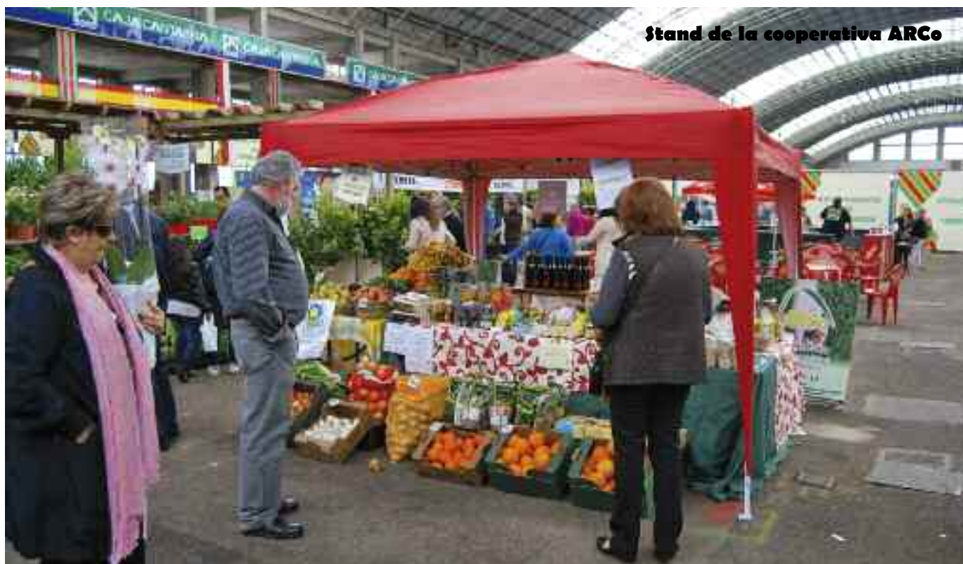
Stand de la cooperativa ARCo

La cooperativa ARCo también participó en esta feria con un stand de productos horto-frutícolas