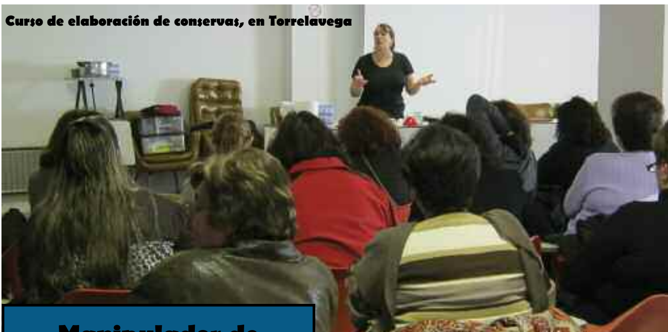
Curso de elaboración de conservas, en Torrelavega

Infórmate de nuestros cursos a través del teléfono 942 80 25 32 y en nuestra oficina del Mercado Nacional de Ganados de Torrelavega