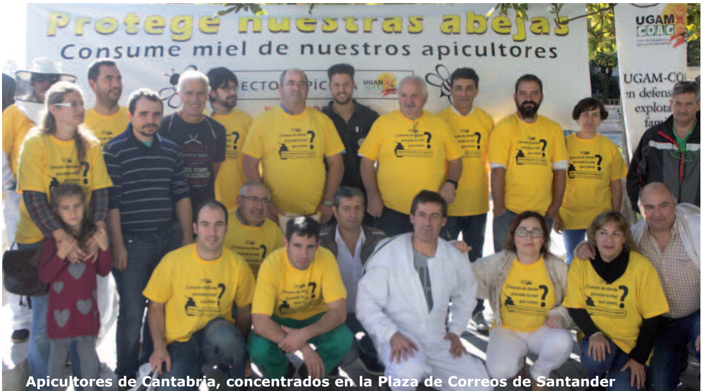
Apicultores de Cantabria, concentrados en la Plaza de Correos de Santander

**Esta acción, llevada a cabo en toda España, supone el pistoletazo de salida de una campaña que tendrá continuidad en los próximos meses para conseguir que sea obligatorio detallar el país de origen.