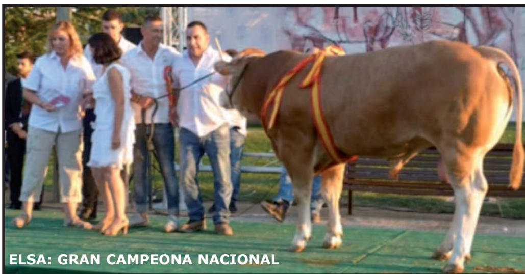
ELSA: GRAN CAMPEONA NACIONAL