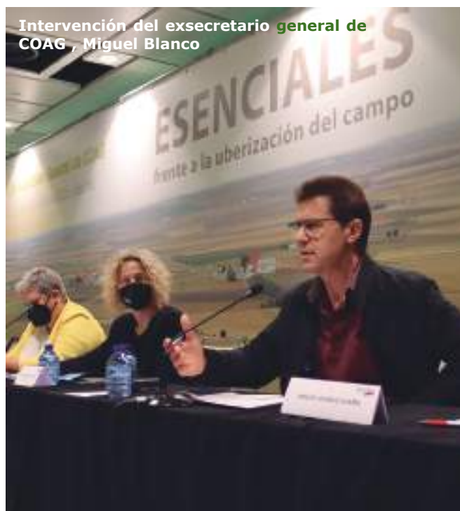
Intervención del exsecretario general de COAG, Miguel Blanco