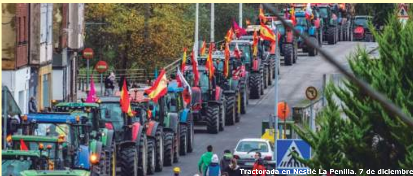
Tractorada en Nestlé La Penilla. 7 de diciembre

Los ganaderos de Cantabria, convocados por UGAM-COAG junto a las demás Organizaciones Agrarias regionales se han manifestado frente a las industrias y a los principales centros de distribución de Cantabria para reivindicar lo que es suyo: un precio por encima de costes para la leche y también para la carne, que les permita vivir dignamente de su trabajo.