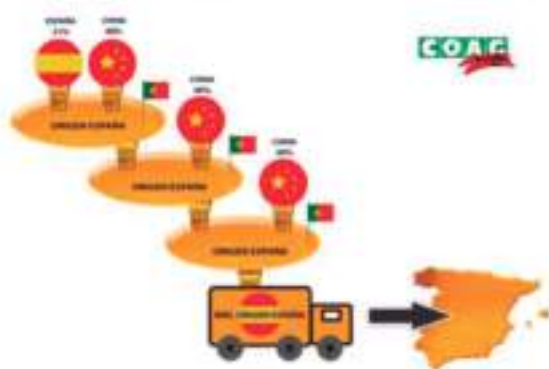
DESCRIPCIÓN GRÁFICA DEL PROCESO DE MEZCLAS Y TRIANGULACIÓN

Ante esta situación, COAG y OCU piden a la Unión Europea y al gobierno español que se modifique la normativa en torno al etiquetado y origen de la miel para que se evite el engaño masivo al consumidor, al tiempo que se pide a las autoridades competentes que se abra una investigación para determinar dónde está ese significativo porcentaje de miel china que entra cada año en España y no aparece en las etiquetas