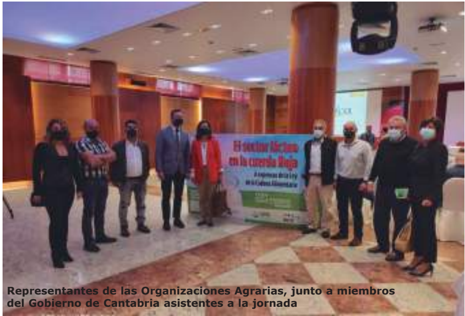
Representantes de las Organizaciones Agrarias, junto a miembros del Gobierno de Cantabria asistentes a la jornada

El pasado año, el Ministro de Agricultura, Luis Planas, introdujo un Real Decreto a la ley antigua para que se pagase un precio en origen por encima del de producción. “Ahora hay que hacerlo cumplir y nos consta que