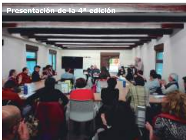
Presentación de la 4ª edición