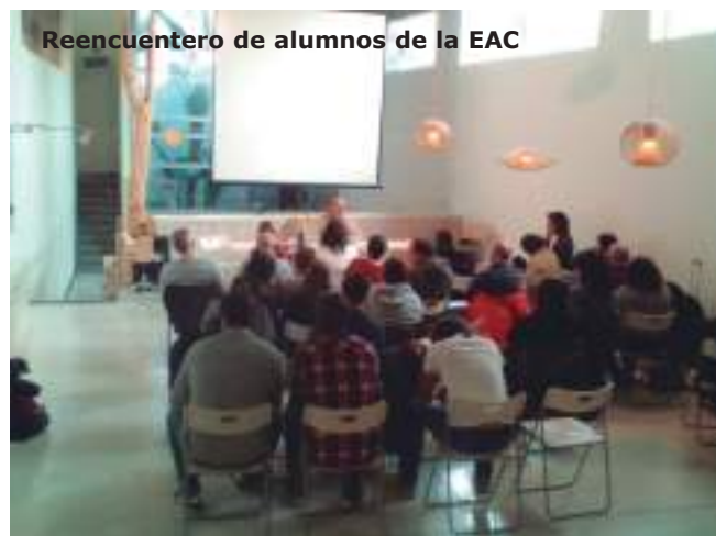
Reencuentro de alumnos de la EAC