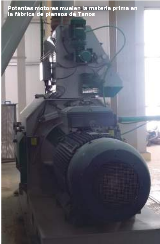
Potentes motores muelen la materia prima en la fábrica de piensos de Tanos

Queremos ser capaces de suministrar todos los IGP que nos demanden nuestros clientes. Hoy se mata un volumen importante, pero hay superficies que necesitan más. Entonces, el futuro es fomentar la relación entre el ganadero de vaca nodriza que vende el pastero de IGP y el ganadero que puede cebar ese ternero. Ese vínculo interno entre ganaderos de Cantabria es lo que puede formar muchos pequeños cebaderos (60-70). Ha salido hace poco una orden que facilita esto. Creo que es ahora mismo nuestro objetivo principal. Consolidar la IGP como se merece y tener un número de animales entorno a 3000 a corto plazo y 6000-7000 a largo plazo. Este es un número muy razonable de terneros que se pueden cebar en Cantabria, que son tres veces más de los que se ceban hoy y lleva su proceso.