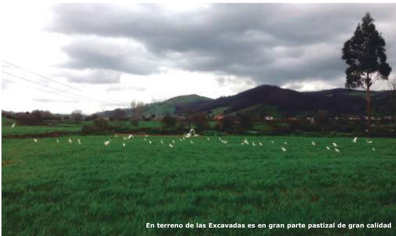
En terreno de las Excavadas es en gran parte pastizal de gran calidad

La construcción de este centro tecnológico supone la destrucción de una reserva del terreno fértil, que actualmente tiene uso agrario por parte de varios ganaderos de la zona