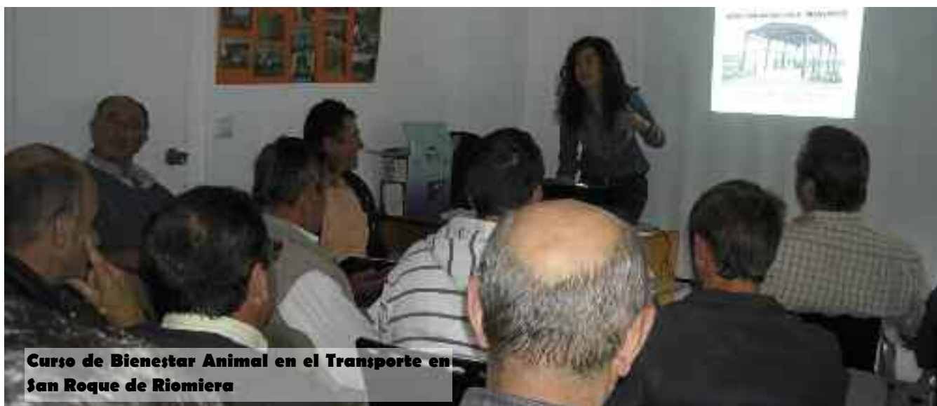
Curso de Bienestar Animal en el Transporte en San Roque de Riomiera

Además, se impartió un curso de informática aplicado a la ganadería en Camaleño para ganaderos de asesoramiento y sus familiares.