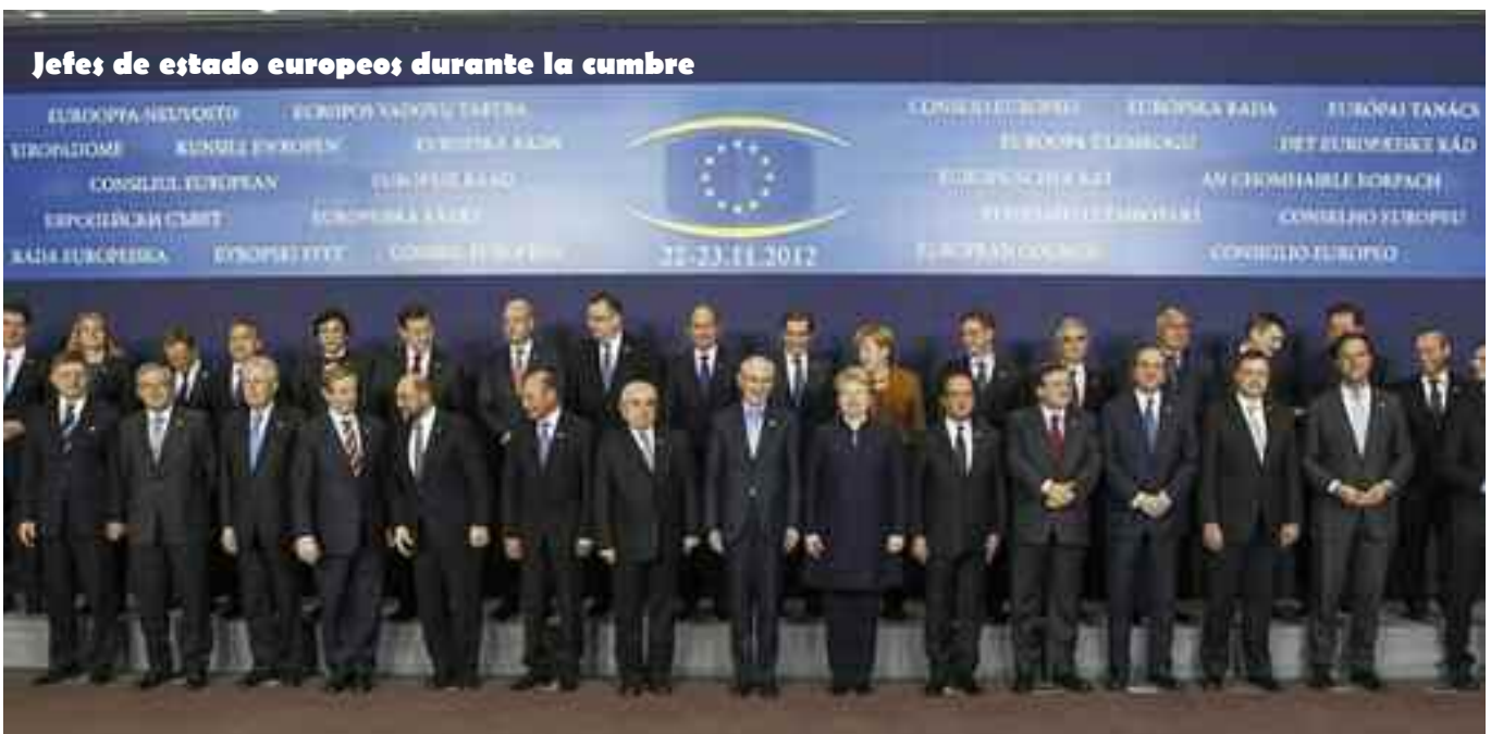
Jefes de estado europeos durante la cumbre

No se ha alcanzado acuerdo en la cumbre de los jefes del Estado y Gobierno de la Unión Europea, celebrada el 23 de noviembre en Bruselas, sobre los presupuestos para el período 2014-2020. Por lo tanto, la propuesta del presidente del Consejo Europeo (Van Rompuy) que cifraba el recorte total de los fondos agrícolas para el periodo 2014-2020 en 63.000 millones de euros, -15% respecto a la programación 2007-2013, no ha sido aceptada.