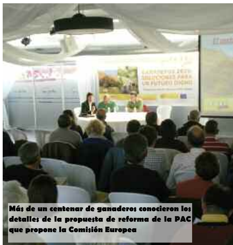
Más de un centenar de ganaderos conocieron los detalles de la propuesta de reforma de la PAC que propone la Comisión Europea