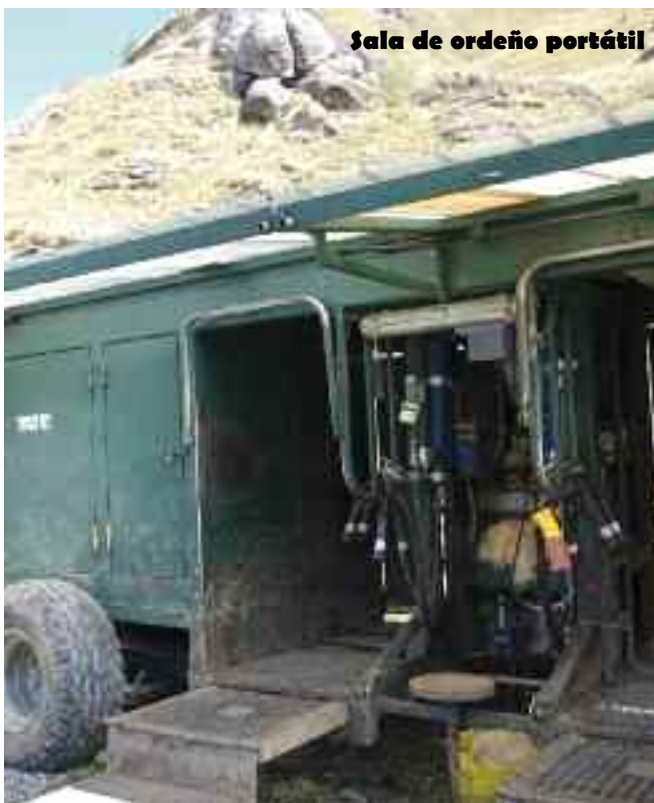
Sala de ordeño portátil

En la Denominación de Origen (DO) mantienen un control exhaustivo de la totalidad de queso producido, para que no haya excedentes y "evitar que sean utilizados por la industria (distribución) para meter mano de alguna manera en la DO" . Incluso Lactalis ofrece precios de hasta 0,70 euros/litro precios, muy por encima de los pagados por la cooperativa (0,58) . Xavier afirma que "la industria no tiene capacidad de entrar, ya que entre las cooperativas y los queseros individuales controlan más de 80% de la producción de queso, pero si tienen capacidad de incidir en la distribución, pues prácticamente en su totalidad manos de intermediarios" . La crisis no les ha estado afectando, pero si son conscientes del riesgo que supone que la distribución esté en manos de 3 ó 4 mayoristas.