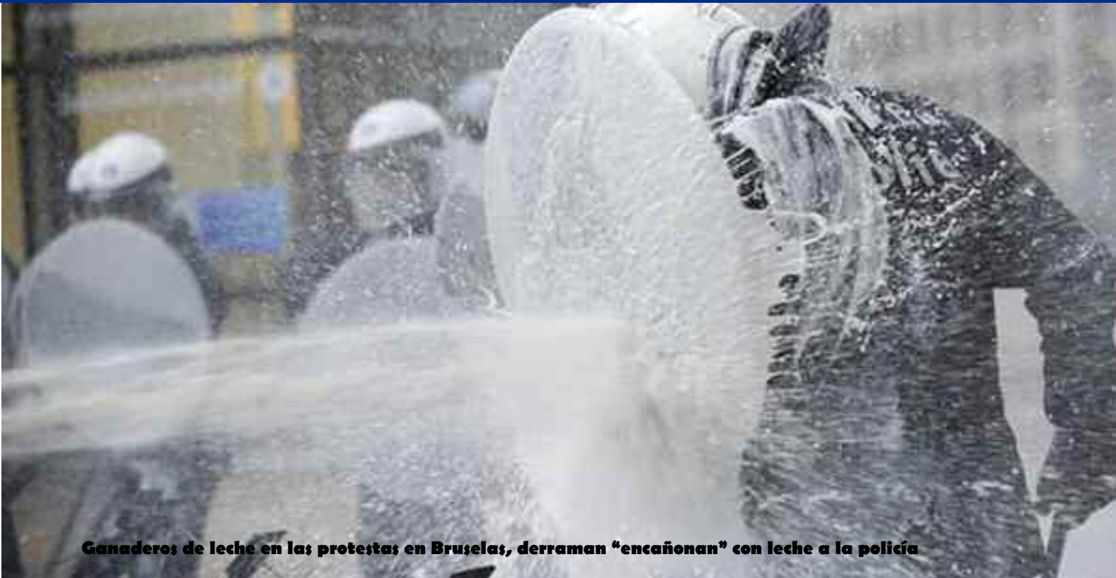
Ganaderos de leche en las protestas en Bruselas, derraman “encañonan” con leche a la policía

La Organización Agraria UGAM-COAG muestra su respaldo a las acciones de protesta de los ganaderos gallegos convocadas por el Sindicato Lábrago Galego SLG, (organización integrada en COAG), para reclamar precios dignos de la leche en el campo. Ante la crítica situación que vive el sector, no descarta que los actos de movilización se generalicen a nivel estatal.