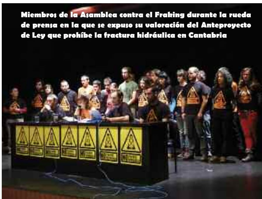
Miembros de la Asamblea contra el Fraking durante la rueda de prensa en la que se expuso su valoración del Anteproyecto de Ley que prohíbe la fractura hidráulica en Cantabria

Tras la presentación el pasado 27 de octubre del Anteproyecto de Ley que prohíbe la fractura hidráulica en Cantabria, la Asamblea contra la Fractura Hidráulica ha valorado positivamente esta acción como muestra de rechazo a la fractura hidráulica por parte del gobierno autonómico y el resto de fuerzas políticas de la comunidad autónoma, por sus inaceptables impactos sobre el territorio y las comunidades que lo habitan. Además, la Asamblea Contra el Fraking, ha alertado en un comunicado que de los permisos existentes en Cantabria, el gobierno autonómico sólo tiene competencias sobre el permiso de investigación Arquetu , que afecta a los valles de Saja y Nansa. El resto de permisos que afectan a nuestro territorio (Luena, Bezana, Bigüenzo, Angosto-1, Usapal y Galileo) son competencia del Ministerio de Industria, Energía y Turismo, por lo que la futura ley en ningún caso podría derogar estos últimos permisos. Por lo tanto esperan el texto definitivo de la ley que, según declaraciones del Partido Popular, será aprobado a finales del primer semestre de 2013 para poder hacer una valoración de su utilidad práctica para