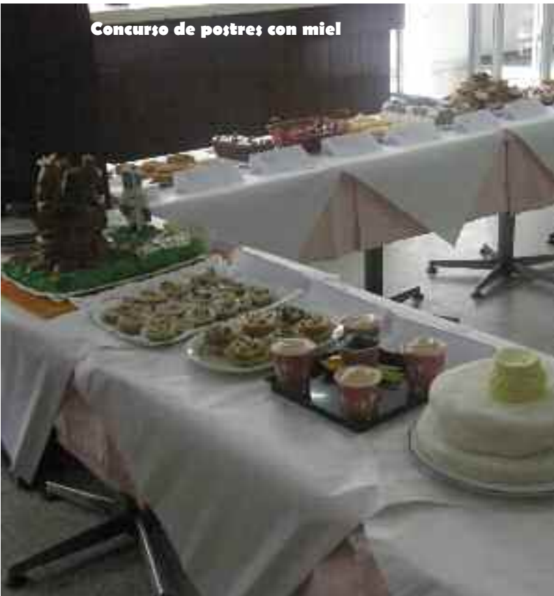
Concurso de postres con miel