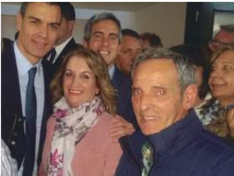
Arriba izqda: Pedro Sánchez, junto a diferentes representantes políticos de la región.