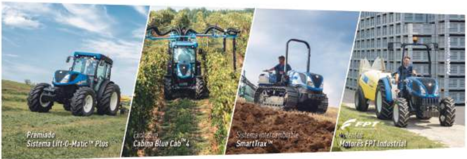
Premiado Sistema Lift-O-Matic™ Plus