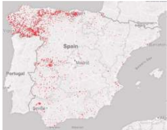
En rojo, los incendios forestales intencionados 2001-2015 (datos del informe "España en Llamas"/F. C.Civio)

La mayoría de esos incendios son intencionados, como demuestra desde 2012 la investigación continuada en el tiempo de 'España en Llamas' de la Fundación Ciudadana Civio. En este punto lleva razón (o casi) Revilla cuando declara que "hay que hablar de incendios intencionados en el 99% de los casos". En el conjunto de España, en el periodo 2001-2015, el 55% de los fuegos fueron intencionados; en algunas comunidades como Galicia se supera el porcentaje del 80%. No en vano, entre los 100 municipios