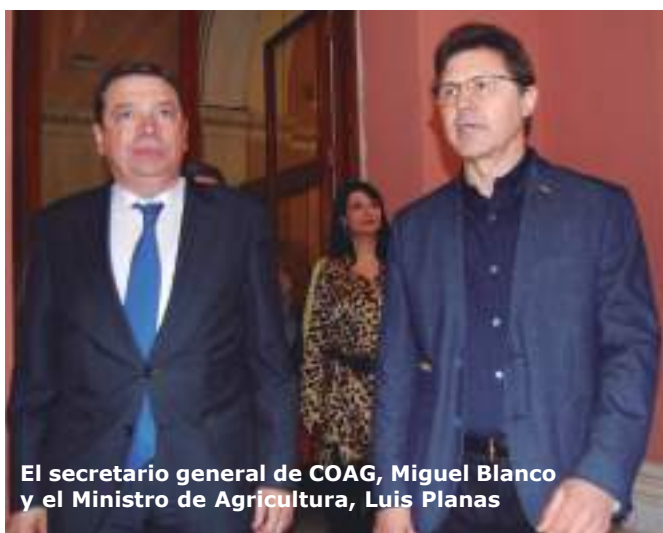
El secretario general de COAG, Miguel Blanco y el Ministro de Agricultura, Luis Planas