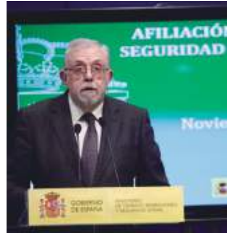
El secretario de Estado de la Seguridad Social, Octavio Granados

actualidad hasta un 23,8% en el 2022 (progresivamente año a año) es inaceptable, puesto que perjudicaría de manera muy importante a los ganaderos y agricultores que elijan una cotización con bases superiores, que les permita acceder a una jubilación equiparable al resto de la sociedad.