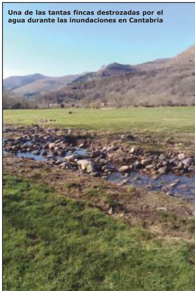
Una de las tantas fincas destrozadas por el agua durante las inundaciones en Cantabria

Para generar estas posibles ayudas el plazo que ha puesto Protección Civil para recibir informes de daños es el 25 de febrero, y así poder enviarlo a Madrid a finales de marzo.