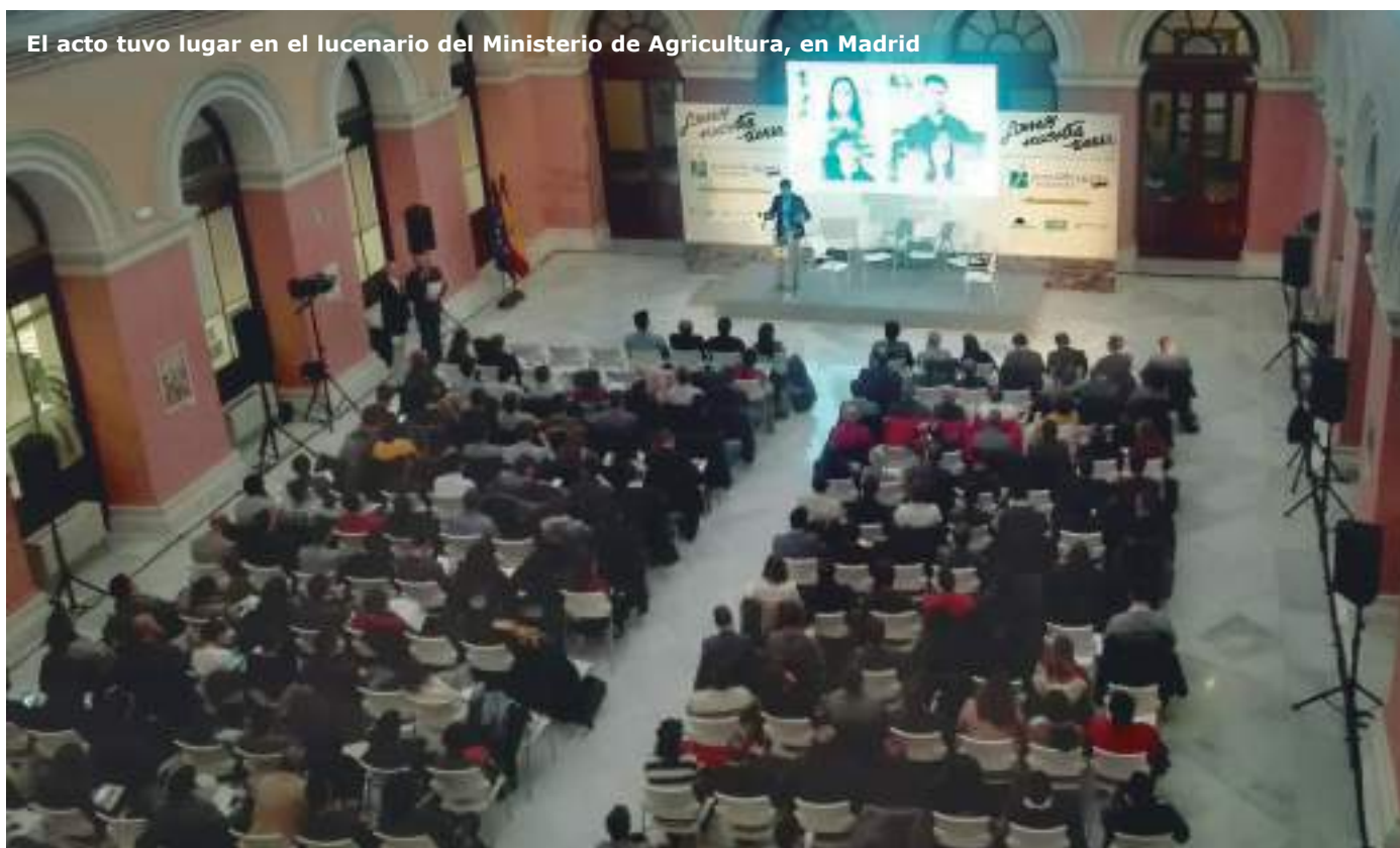
El acto tuvo lugar en el lucenario del Ministerio de Agricultura, en Madrid