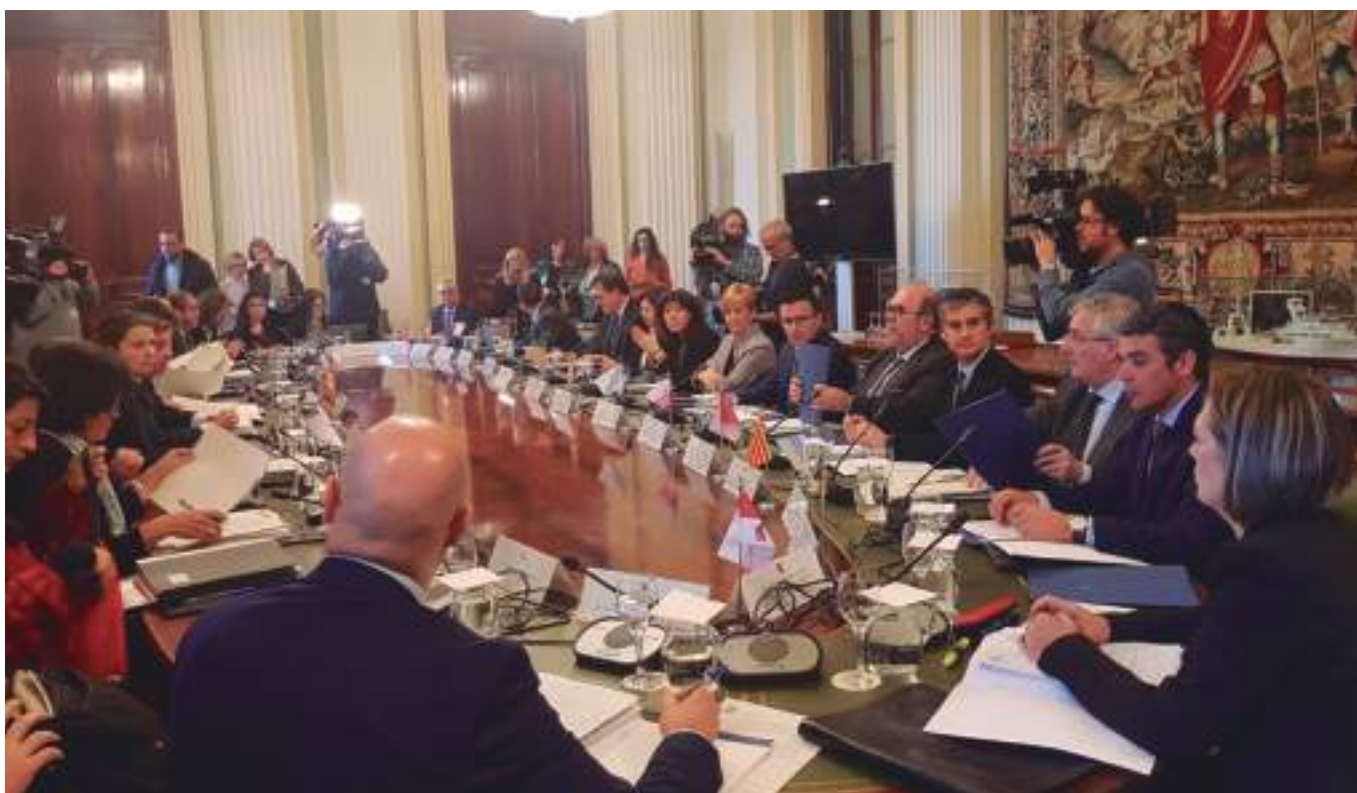
Reunión de los responsables de Medio Rural

Este principio de acuerdo va en consonancia con la propuesta que puso Aragón sobre la mesa y a la que siguieron otras Comunidades Autónomas como Cantabria