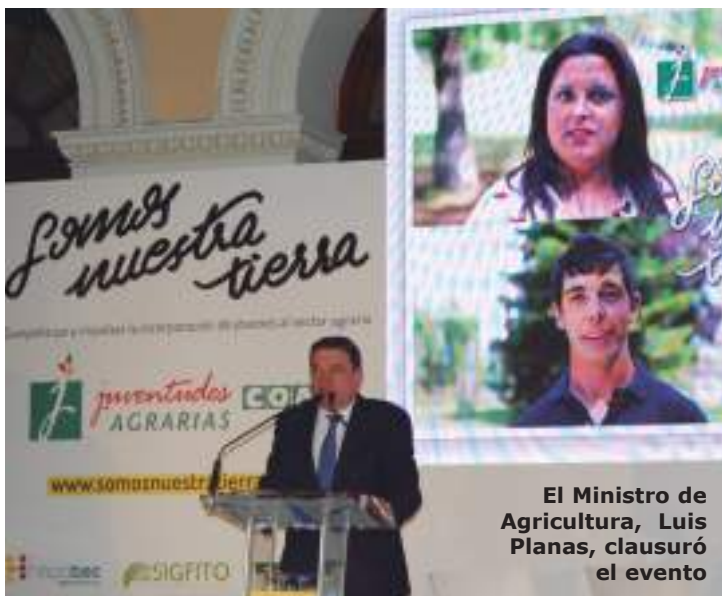
El Ministro de Agricultura, Luis Planas, clausuró el evento