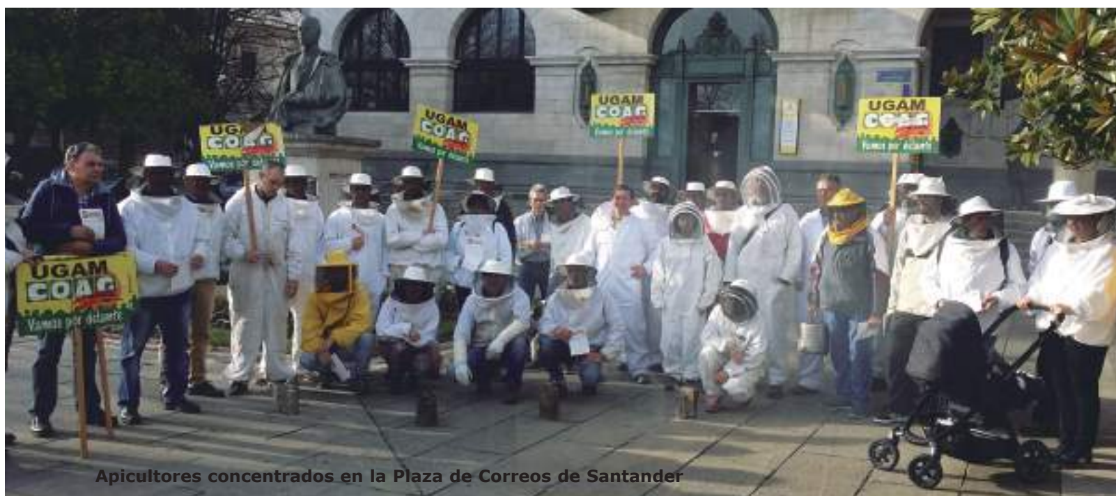
Apicultores concentrados en la Plaza de Correos de Santander

Esta concentración se enmarcó en las movilizaciones convocadas por la Organización Agraria COAG, a nivel nacional, que aglutinaron a cientos de apicultores frente a grandes superficies comerciales para reclamar un mayor control de las importaciones y sucedáneos de miel de baja calidad, especialmente de China, y un etiquetado más transparente que obligue a detallar el país de origen