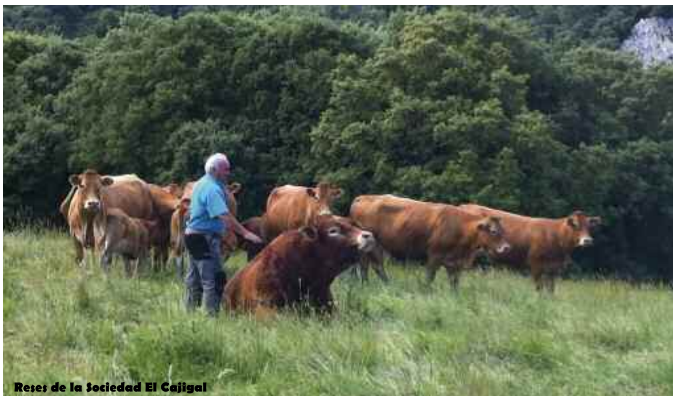
Reses de la Sociedad El Cajigal

“La consejería nos advirtió que podrían salir más casos de brucelosis y decidieron sacrificarlas todas”