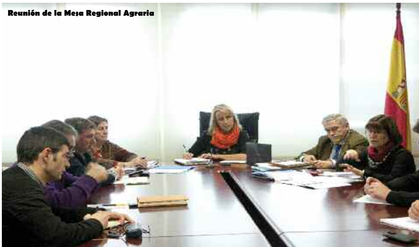
Reunión de la Mesa Regional Agraria

U GAM-COAG ha solicitado formalmente a la consejería de Ganadería que las ayudas a reposición para las ganaderías que hayan sido objeto de vacío sanitario se unifiquen en un único criterio: el pago máximo (800 €) para la reposición de vacas mayores de dos años.