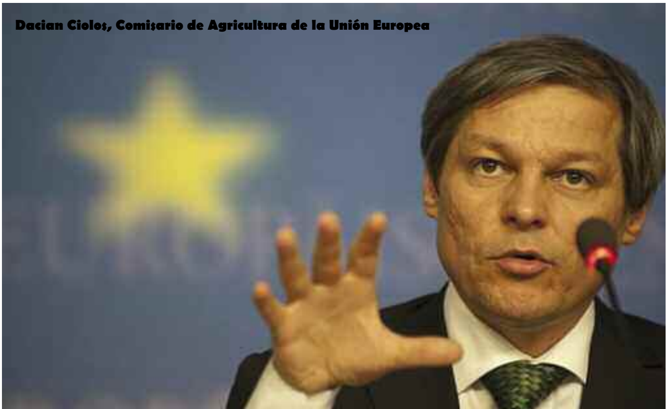
Dacian Cioloș, Comisario de Agricultura de la Unión Europea

E l Comisario de Agricultura de la Unión Europea, Dacian Cioloș, ha informado de un posible aplazamiento de la nueva Política Agraria Comunitaria para el 2015.