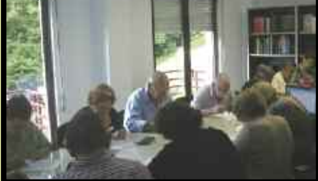
Curso de memoria en Luena

La Asociación de Personas Mayores y Familiares Solidaridad Intergeneracional , que tiene convenio de colaboración con el sindicato agrario UGAM COAG, está llevando a cabo los proyectos para el Envejecimiento Activo y el Aprendizaje Intergeneracional y Cuidados al Cuidador subvencionados por el Instituto Cantábrego de Servicios Sociales. Estos talleres ya se han llevado a cabo en Villanueva, Mazcuerras, Ibio, Luena, San Vicente de Toranzo y comenzarán en breve en Pesquera y Santiurde de Toranzo.