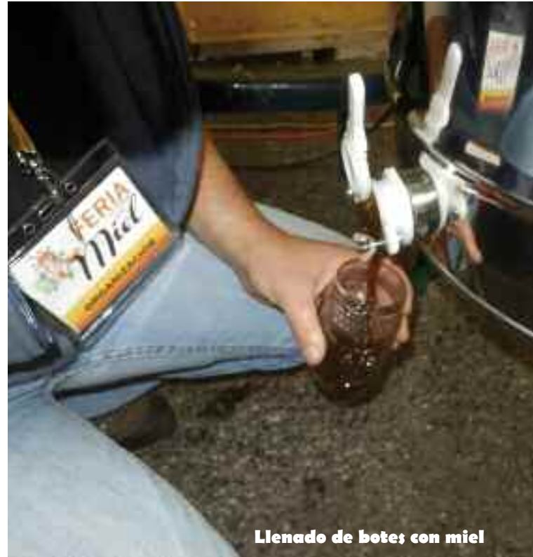
Llenado de botes con miel