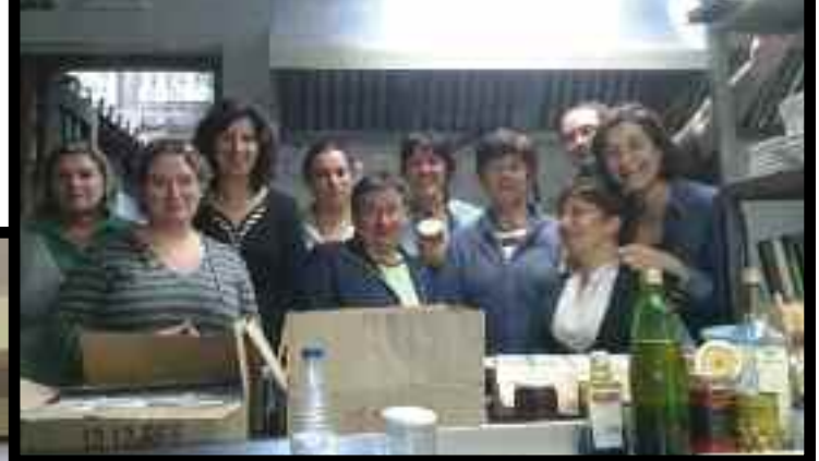
Curso de conservas