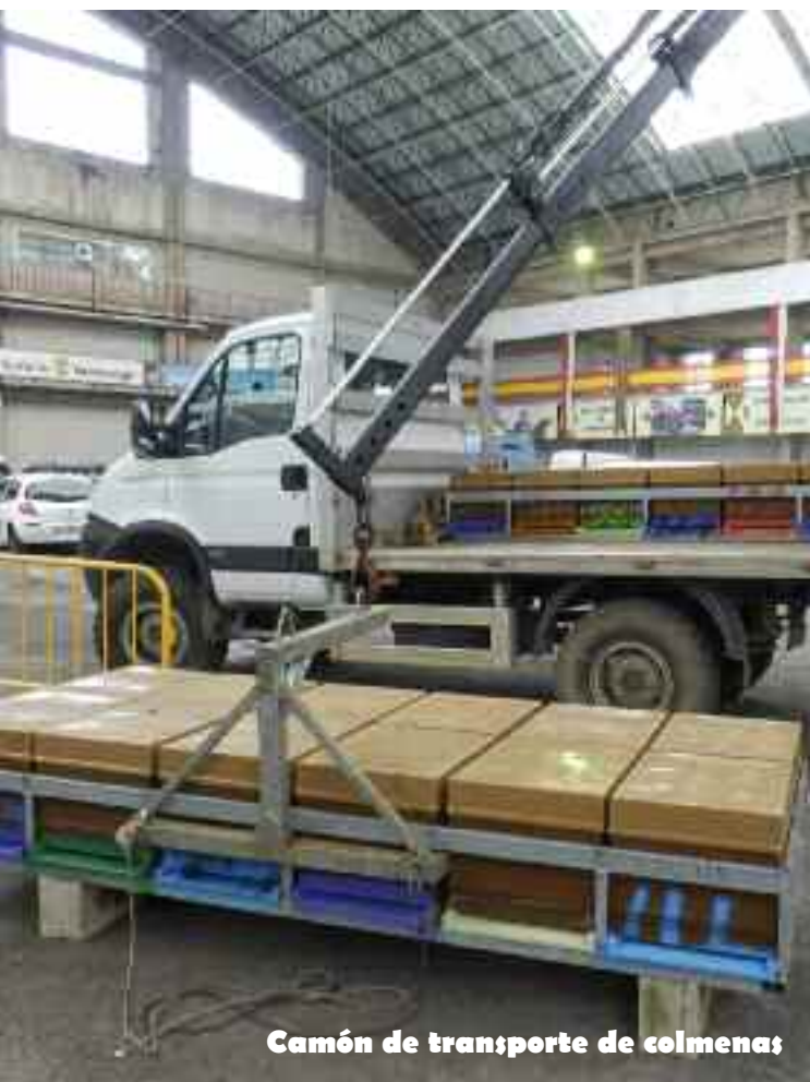
Camión de transporte de colmenas