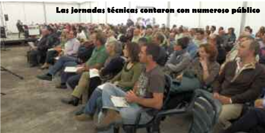
Las jornadas técnicas contaron con numeroso público