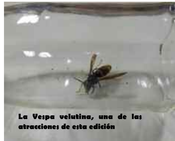
La Vespa velutina, una de las atracciones de esta edición

records de participación de apicultores venidos de toda España (Guadalajara, Cáceres, Valladolid, Guipúzcoa, Vizcaya, Burgos, Asturias, Palencia, Barcelona, Aragón, Málaga, etc. y también de Portugal y Francia tanto en 12 autobuses, como en coches particulares e incluso en transporte público), de asistencia de público (en torno a las 8.000 personas), de número de expositores (34), de repercusión mediática y en muchos casos de ventas a pesar de la crisis. La inauguración estuvo a cargo de