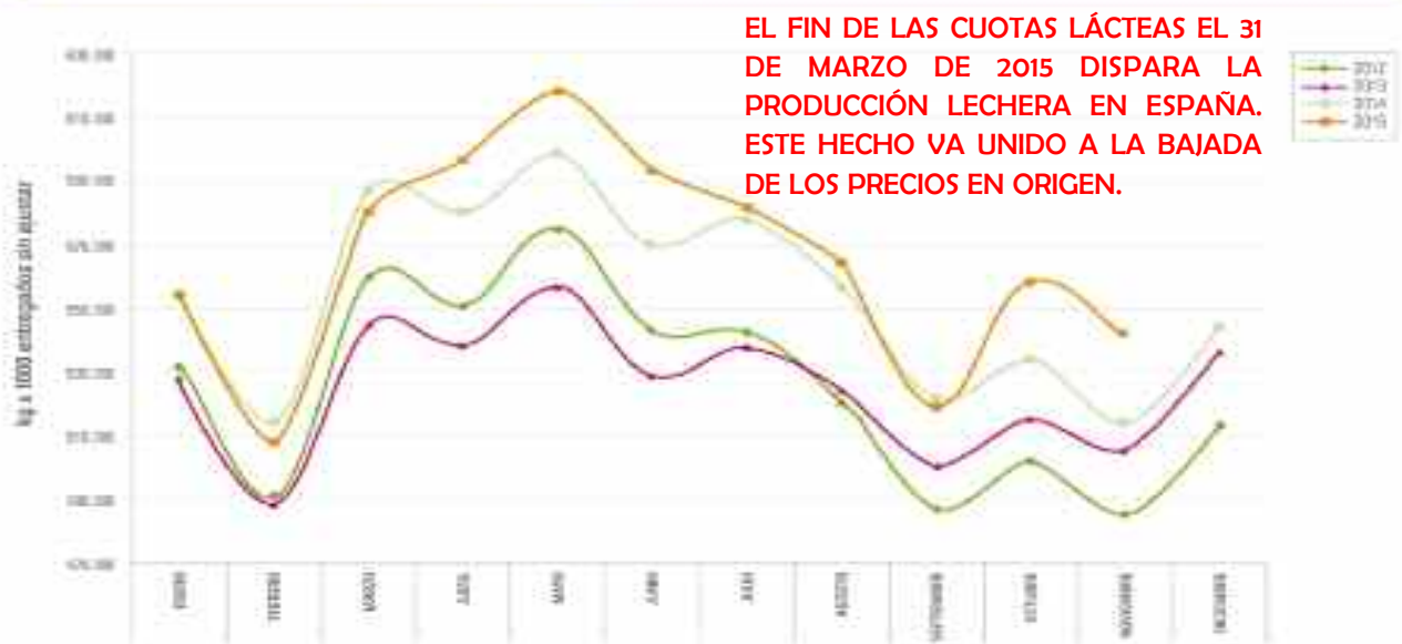
III. TOTAL LECHE PRODUCCIÓN POR COMUNIDAD AUTÓNOMA (t)