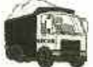
OPAMEL HAMA 20 Lit.