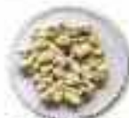
Gravado GRSUESO (2-4 mm)