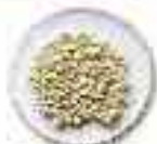
Gravado MEDIO (1-2 mm)