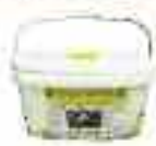
CUBOS 3 Lit.