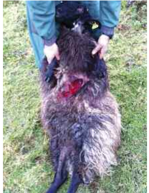
Ataques de lobos en Rioseco (Rionansa)

Las actuaciones de control se realizarán mediante ‘Intervenciones tempranas’, de forma inmediata tras la producción de los daños, ya que esta es la forma más eficaz de evitar la recurrencia de los daños.