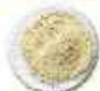
Gravado FINO (<1 mm)