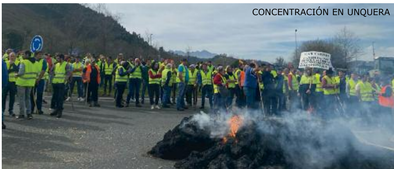
CONCENTRACIÓN EN UNQUERA

Hubo algunos altercados con la guardia civil, principalmente en Colindres y Unquera, donde algunos manifestantes recibieron golpes con porra y empujones por parte de los antidisturbios.