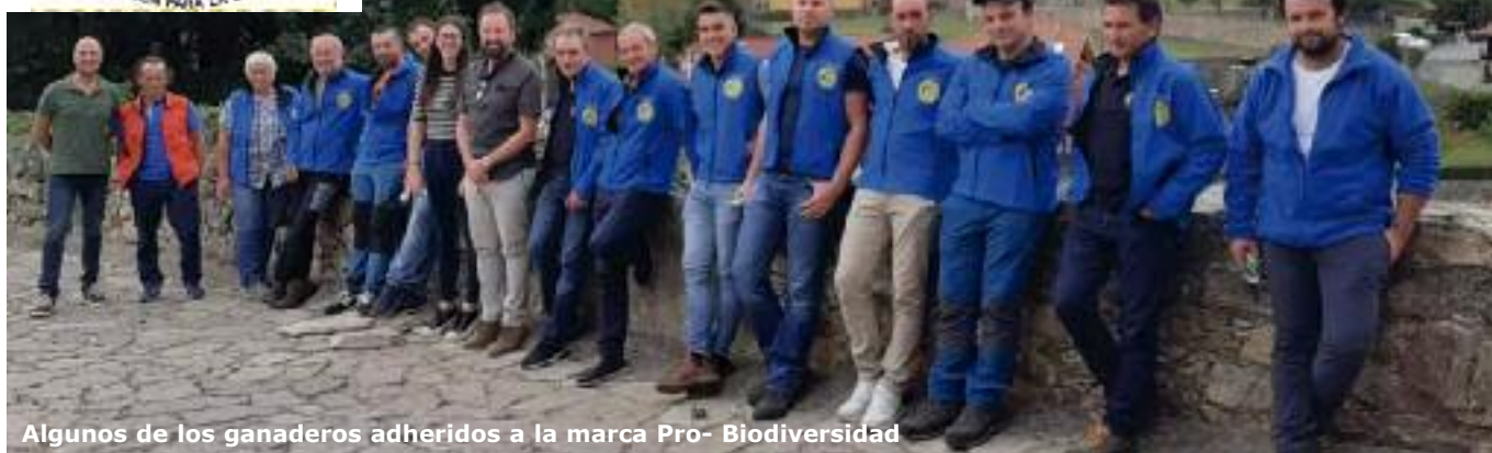
Algunos de los ganaderos adheridos a la marca Pro- Biodiversidad

Desde su creación en 2011, la Marca Pro-Biodiversidad se ha convertido en un símbolo de la armonía entre la conservación de la biodiversidad y el desarrollo de la ganadería de ovino y caprino extensiva criados en los Picos de Europa. Registrada por la Fundación de Conservación del Quebrantahuesos, esta marca ha sido un estandarte para los productos alimenticios originarios de las áreas de Natura 2000, destacando la importancia de prácticas agrícolas y ganaderas que respetan y fomentan la diversidad biológica.