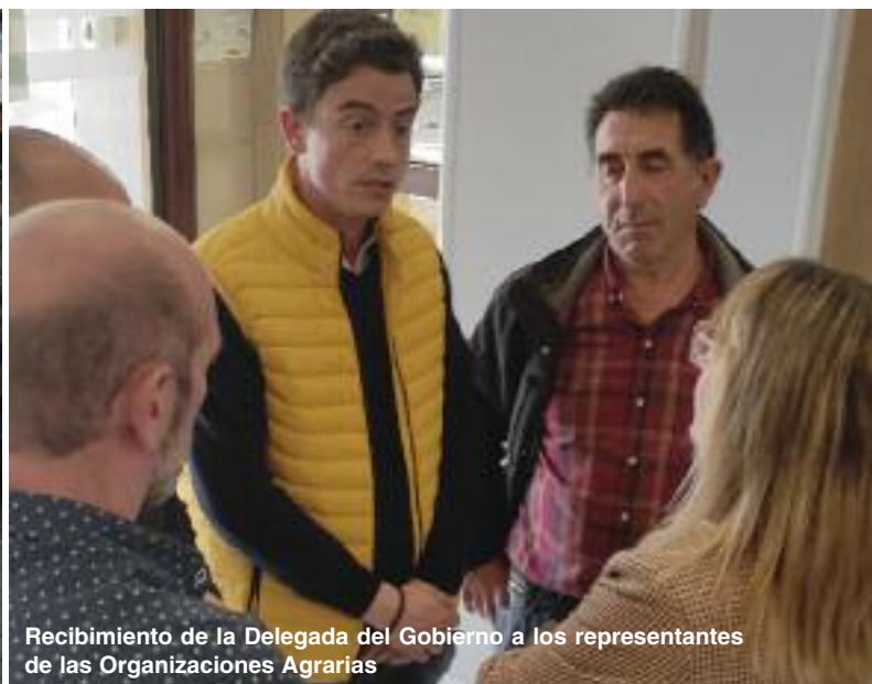
Recibimiento de la Delegada del Gobierno a los representantes de las Organizaciones Agrarias