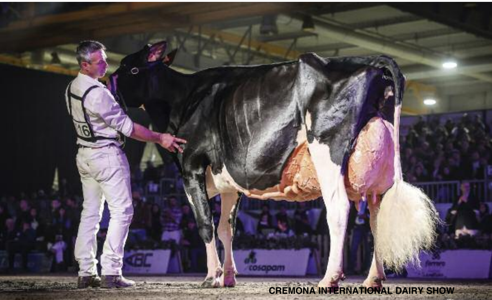
CREMONA INTERNATIONAL DAIRY SHOW

manejar a la población con mucha publicidad. Al final de una mentira, sacan una verdad y yo creo que ese va a ser el principal problema que vamos a tener.