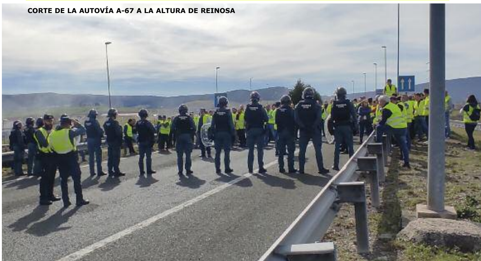
CORTE DE LA AUTOVÍA A-67 A LA ALTURA DE REINOSA

E l 20 de febrero, las Organizaciones Agrarias convocaron movilizaciones ganaderas que continuaron tras la gran tractorada del día 16 y la improvisada del 17. Estas manifestaciones tuvieron lugar en toda la Cornisa Cantábrica. Una de las reivindicaciones más destacadas se centró en la singularidad de la Cornisa Cantábrica y en la falta de consideración reflejada en la PAC, al no haber ayudas que se ajusten a los pequeños y medianos ganaderos minifundistas. También la retirada del lobo del LESPRES es otra de las grandes reivindicaciones de las CCAA de la Cornisa.