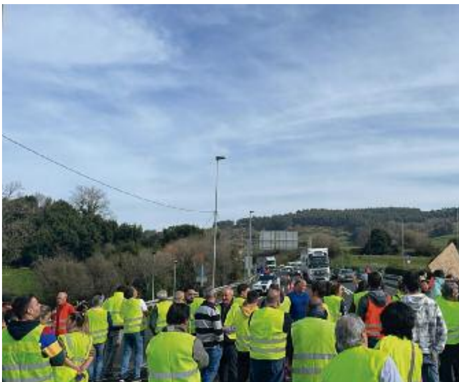
CONCENTRACIÓN EN LA A-8, EN COLINDRES