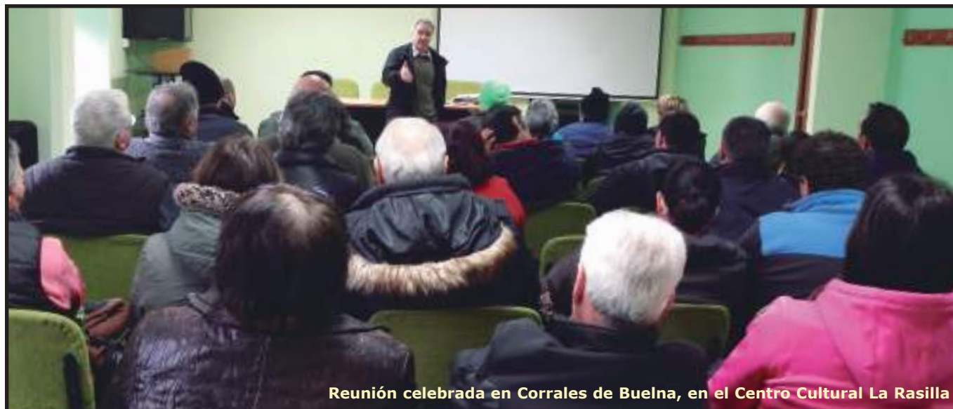
Reunión celebrada en Corrales de Buelna, en el Centro Cultural La Rasilla

Las reuniones han contado con una amplia asistencia de soci@s