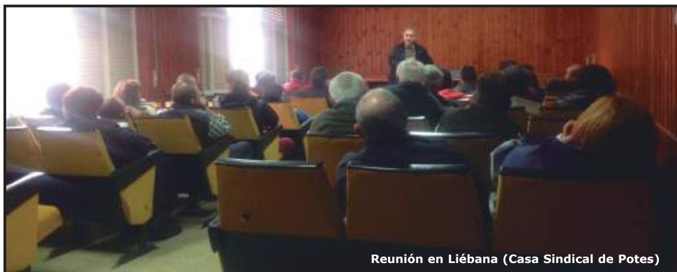
Reunión en Liébana (Casa Sindical de Potes)

Como cada temporada, antes de comenzar la tramitación de las ayudas de la PAC, UGAM-COAG organizó charlas por distintos puntos de Cantabria para informar de los temas más relevantes para el sector agrario de Cantabria en la actualidad.