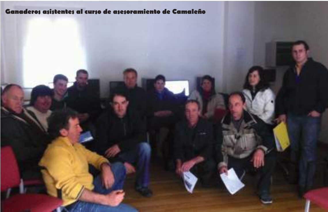
Ganaderos asistentes al curso de asesoramiento de Camaleño

D esde UGAM-COAG se han organizado cursos por toda Cantabria dirigidos a los ganaderos y agricultor que tienen contratado el servicio de asesoramiento con nosotros.