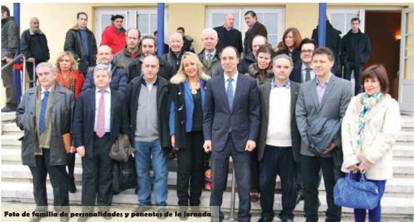
Foto de familia de personalidades y ponentes de la jornada