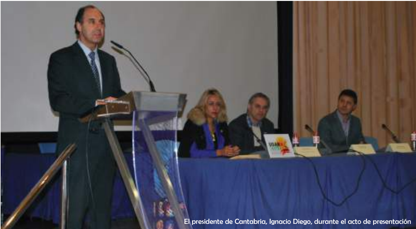
El presidente de Cantabria, Ignacio Diego, durante el acto de presentación

E l pasado 26 de enero, tuvo lugar una jornada sobre la nueva Ley de Medidas para la Mejora del funcionamiento de la Cadena Alimentaria, en el Paraninfo de la Magnadela (Santander).