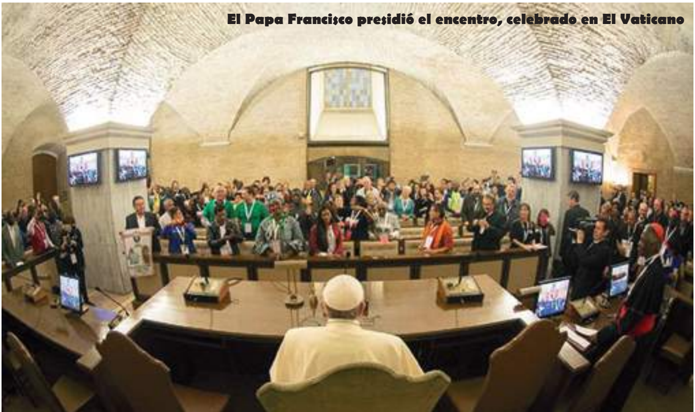
El Papa Francisco presidió el encuentro, celebrado en El Vaticano

La Organización mundial Vía Campesina ha impulsado el Encuentro Mundial de Movimiento Popular en el que han participado diversos movimientos representativos de todo el mundo, junto al Pontificio Consejo de Justicia y Paz y la Academia Pontificia de las Ciencias Sociales, con el apoyo explícito del Papa Francisco. Este encuentro se