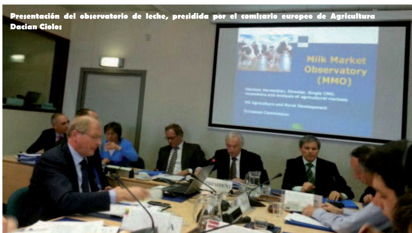
Presentación del observatorio de leche, presidida por el comisario europeo de Agricultura Dacian Cioloș