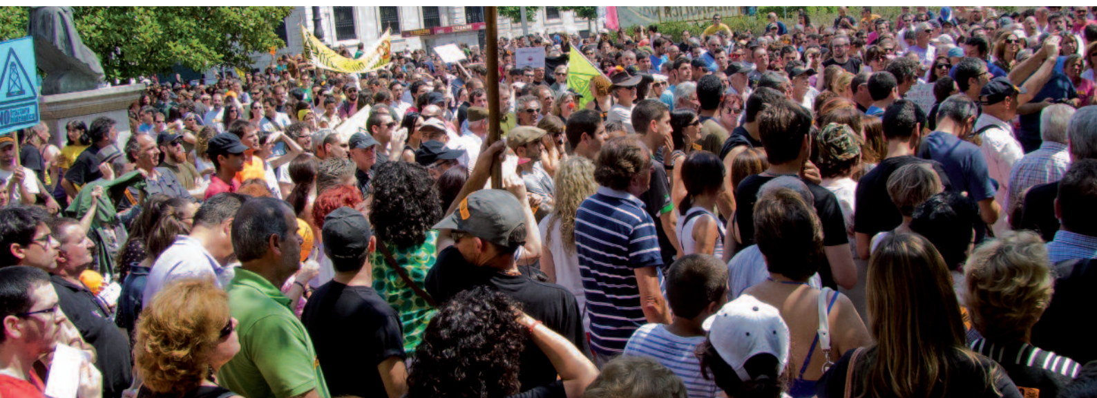
Concentración contra el fracking en Santander

L a Comisión de Peticiones del Parlamento Europeo ha pedido a la Comisión Europea que investigue sobre el permiso de fractura hidráulica en Luena.